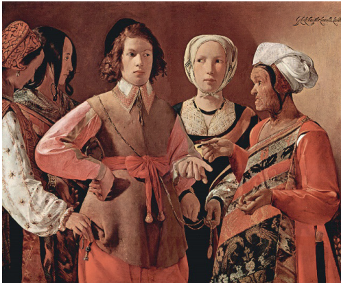
Georges de la Tour, Die Wahrsagerin